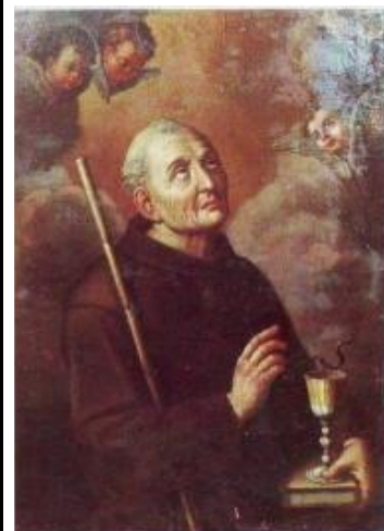
S. Giacomo della Marca